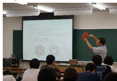
講義風景(筑波大学共同研究棟A)

ナノエレクトロニクス学生との合同交流会では、ナノグリーン学生の出席率がやや低く、コミュニケーション能力育成の観点から、出席率を上げる工夫が必要と運営側の反省もあります。概してナノグリーン人材育成教育プログラムの良い端緒になったと考えます。