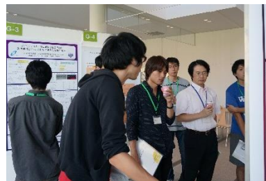
合同ポスターセッション (産総研 TIA連携棟)